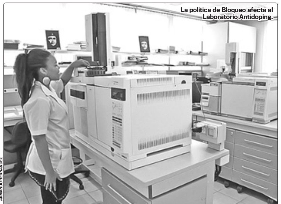
La política de Bloqueo afecta al Laboratorio Antidoping.

NUESTROS atletas paralímpicos se ven afectados por no tener acceso a implementos de última generación que se utilizan en competiciones de carácter internacional, debido a su procedencia estadounidense. Esto los coloca en una posición de desventaja con relación a los atletas del resto de los países. ☒